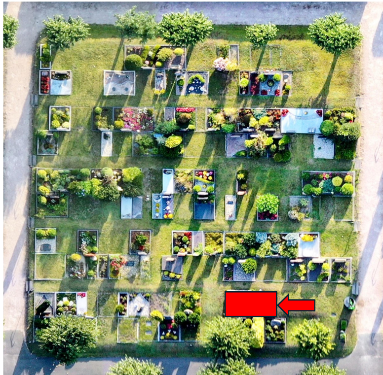
Feld D, 2. Reihe Grab 17 bis 20